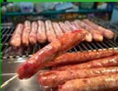
台湾風ソーセージ