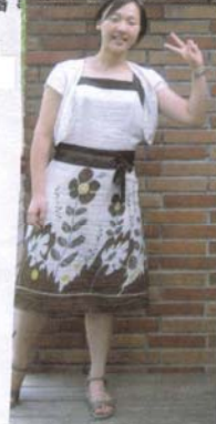
有點熟女的連身洋裝