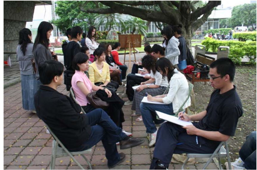
校園人像速寫實習(輔園)