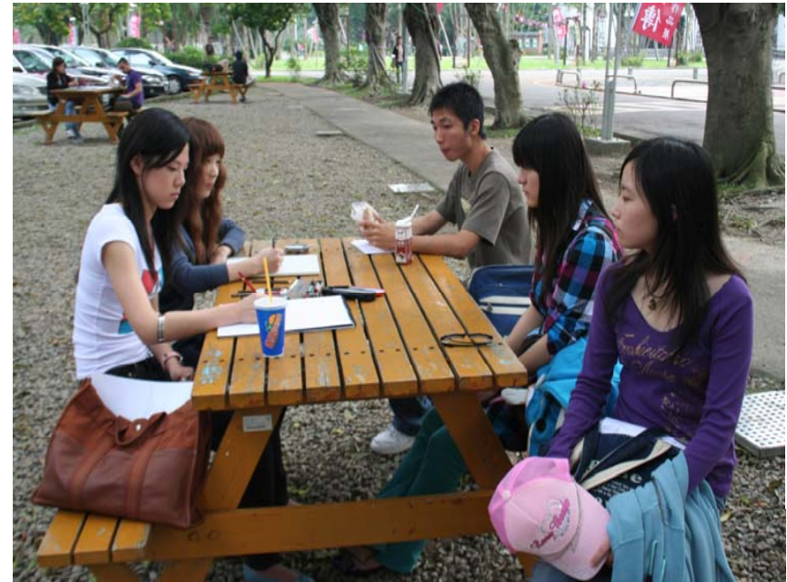
校園人像速寫實習(文德)