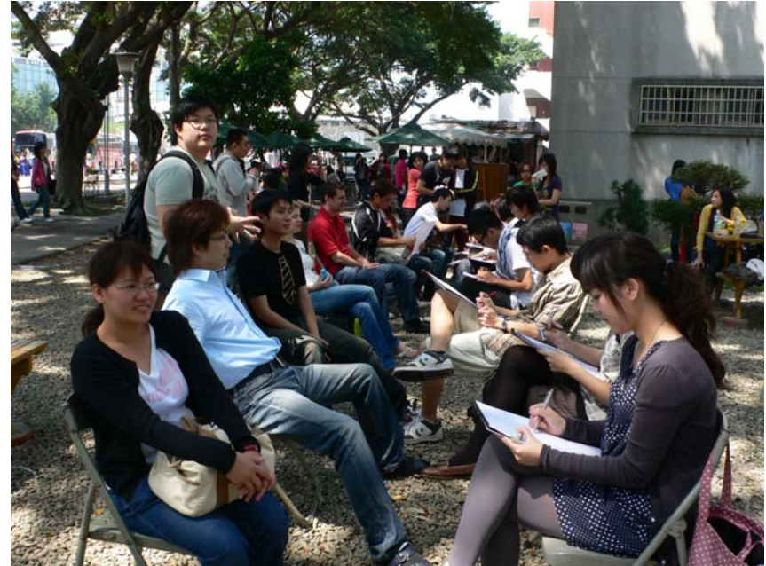
校園人像速寫實習(文德)