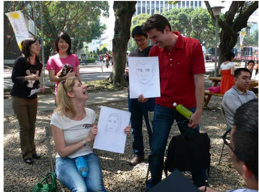
校園人像速寫實習(文德)