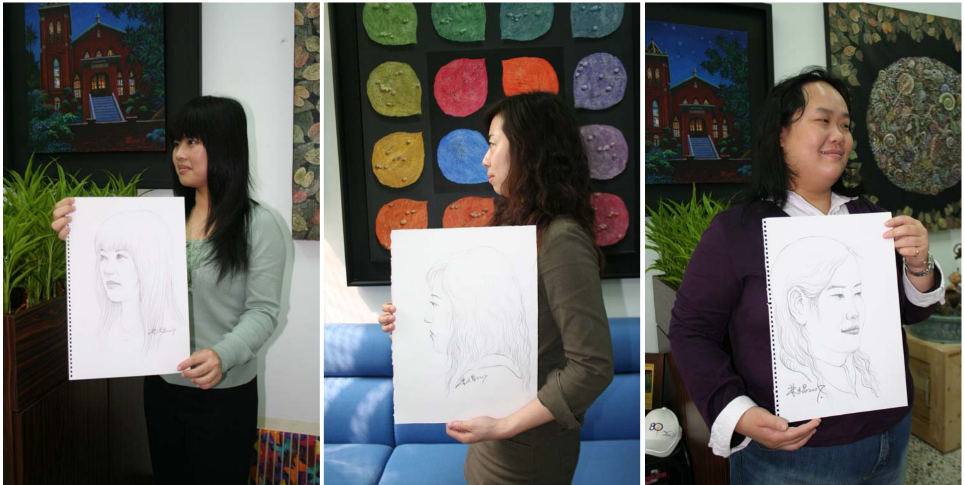
人像速寫示範作品