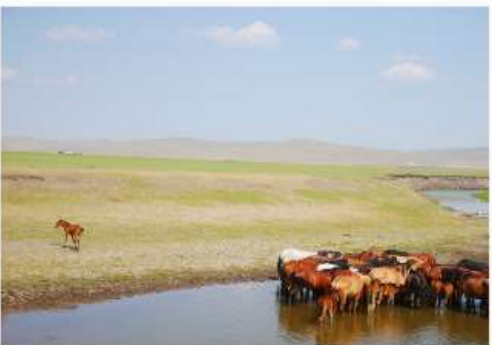
駿馬為者，亦利足也，萬致千里；體身操者，非徒水也，扁絕江河。君子生非與也，亦假於物也。

A：當我到達蒙古，我看見一隻小馬，離開許遠去找屬於自己的天地。當我在泰山腳下，掙扎著要不要爬上去，堅持攻頂之後，才知道泰山的風景比我想像的更美、更高聳。在旅途的過程中本來只是想坐下休息，沒想到卻看到不一樣的風景。