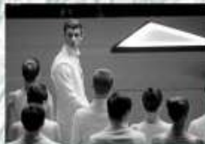
《記憶傳承人》電影預告