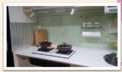
阿苟師製作各式料理的廚房，不僅環境一絲不苟，廚具井然有序。正如阿苟師的為人處事。

我們一切是那樣地自然、那樣地美妙，在黃昏的夕陽下，我們看著阿苟師在廚房裡忙碌著，他的動作是那樣地熟練，他的眼神是那樣地專注。他做廚師是為了能給別人帶來幸福，所以他不計較自己的利益，只在乎別人的幸福。