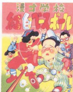
「漫才学校 紅白ヘースボール」／作・ユメ ウツツ／発行年不詳／榎本法令館