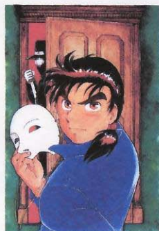
天樹征丸・作 さとうふみや・画 「金田一少年の事件簿」 〔少年マガジン〕→P324