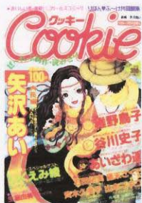
〔Cookie〕 〔集英社 99年10月〕