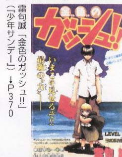
雷句誠「金色のガッシュ!!」 〔少年サンデー〕→P370