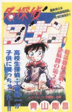
青山剛昌「名探偵コナン」 〔少年サンデー〕→P331