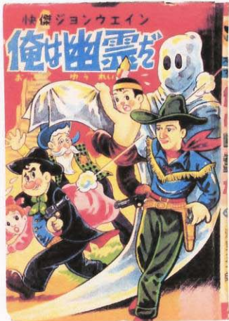
「快傑ジョンウエイン 俺は幽霊だ」／作・湯里五一郎 刊行年不詳／榎本法令館