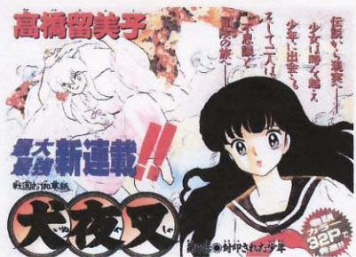
高橋留美子「犬夜叉」 〔少年サンデー〕→P347