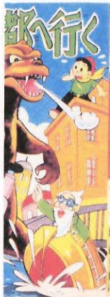
「怪獣漫画 ゴジラと行く」／作・梶野太郎 刊行年、発行元不詳