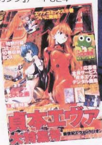
〔月刊少年エース〕 〔角川書店 06年5月号〕