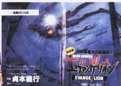
貞本義行「新世紀エヴァンゲリオン」 〔少年エース〕→P338