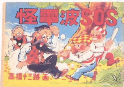
「怪 作 和 刊」